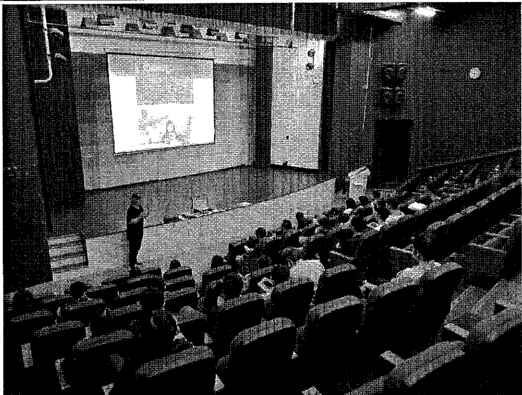
相片及內容說明：第二家廠商講解拍照設備以及畢冊搭配內容。